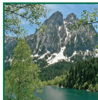
Vista dels Encantats i de l'estany de Sant Maurici