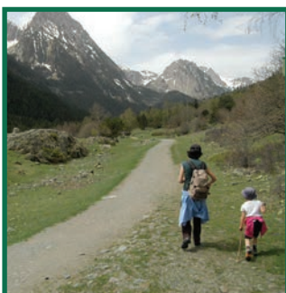
Camí de Sant Maurici des del Prat de Pierró