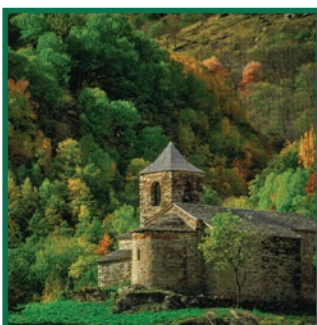
Església de St. Vicenç de Capdella