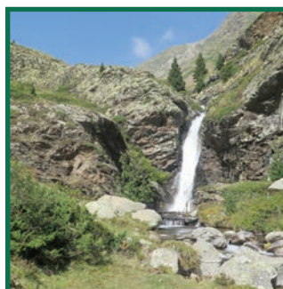
Pontet de Rus