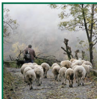
Pastor i ramat d'ovelles