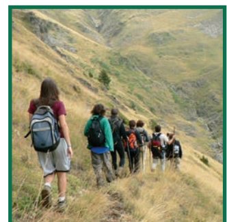
Excursionistes al Parc