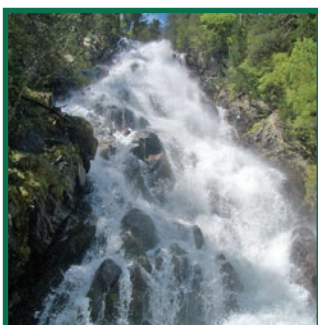
Cascada de Gerber