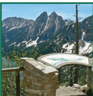
Mirador de l'Estany