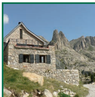
Refugi i Agulles d'Amitges