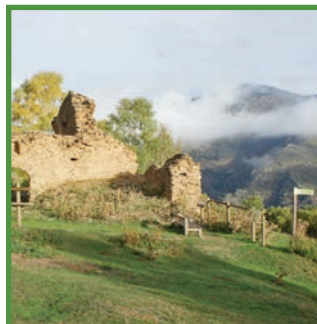
Mirador de Sant Joan de l'Erm vell