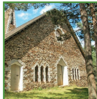
Sant Joan de l'Erm nou