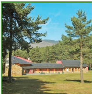
Refugi de la Basseta.