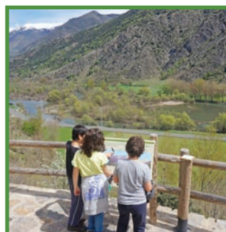
Mirador de la Vinyeta