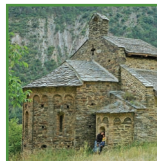
Monestir de Sant Pere del Bungal