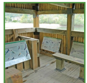
Torre guaita de la Mollera