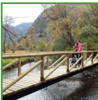
Itinerari de la Llobatera