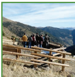
Mirador de Conflent