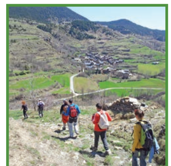
linerari de Civís al Coll d'Ares