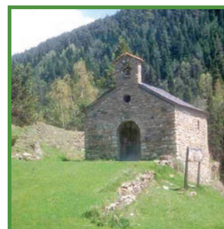
Ermita de Santa Magdalena