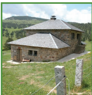
Refugi del Ras de Conques