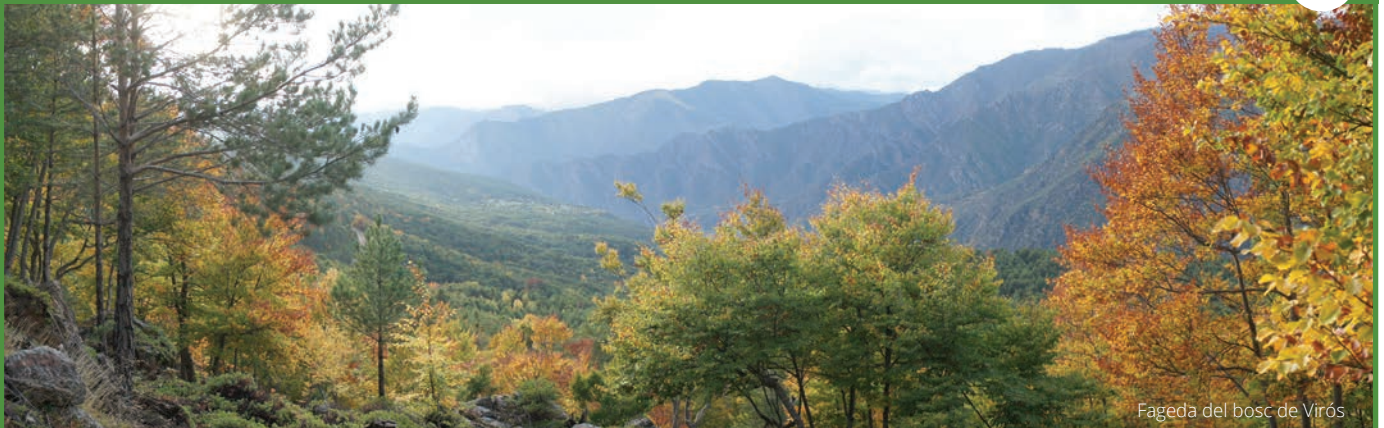
Fageda del bosc de Virós