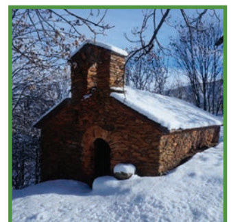
Ermita romànica de Sant Lliser