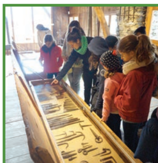
Espai Museístic del Ferro