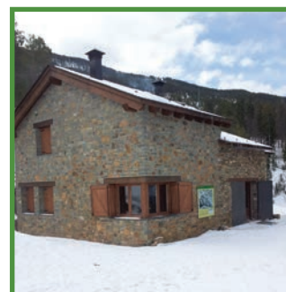
Refugi Gall Fer