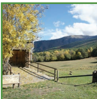
Bordes de Virós