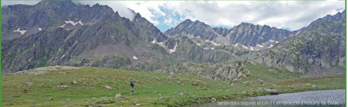
Senderista seguint el GR-11 en direcció a l'estany de Baiau