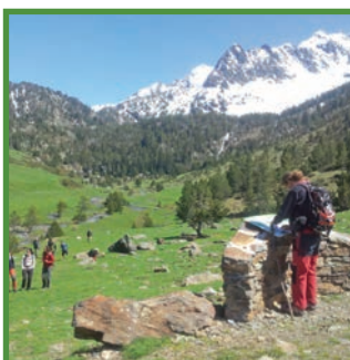
Mirador de Boet