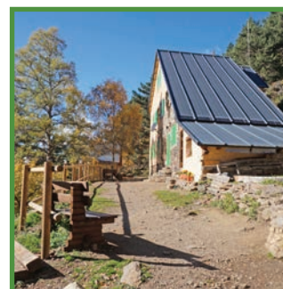
Refugi de Vallferrera