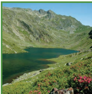
L'estany del Port