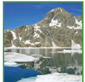
Estany i Pic de Mariola en primavera.