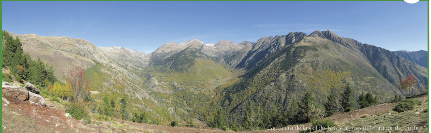
Capçalera de la vall de Tavascan des del mirador del Corbiu