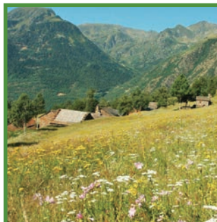
Bordes de Noarre.