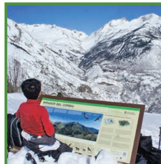
Mirador del Corbiu (Pleta del Prat)