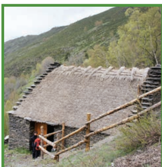
Borda de Llosaus