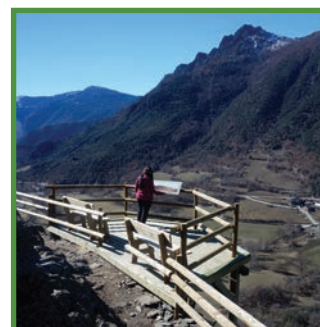
Mirador de la Gorja de Lladrós