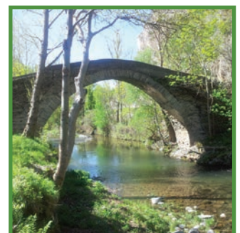
Pont medieval de Cassibrós