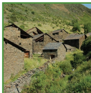
Bordes de Nibrós