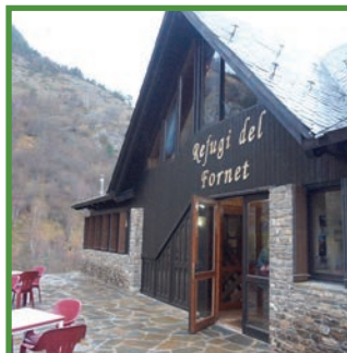
Refugi del Fornet