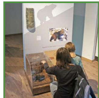
Casa de l' Os Bru dels Pirineus