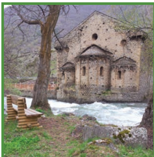
Sant Joan d'Isil