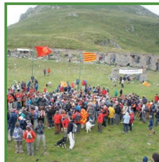
Aplec al Port de Salau