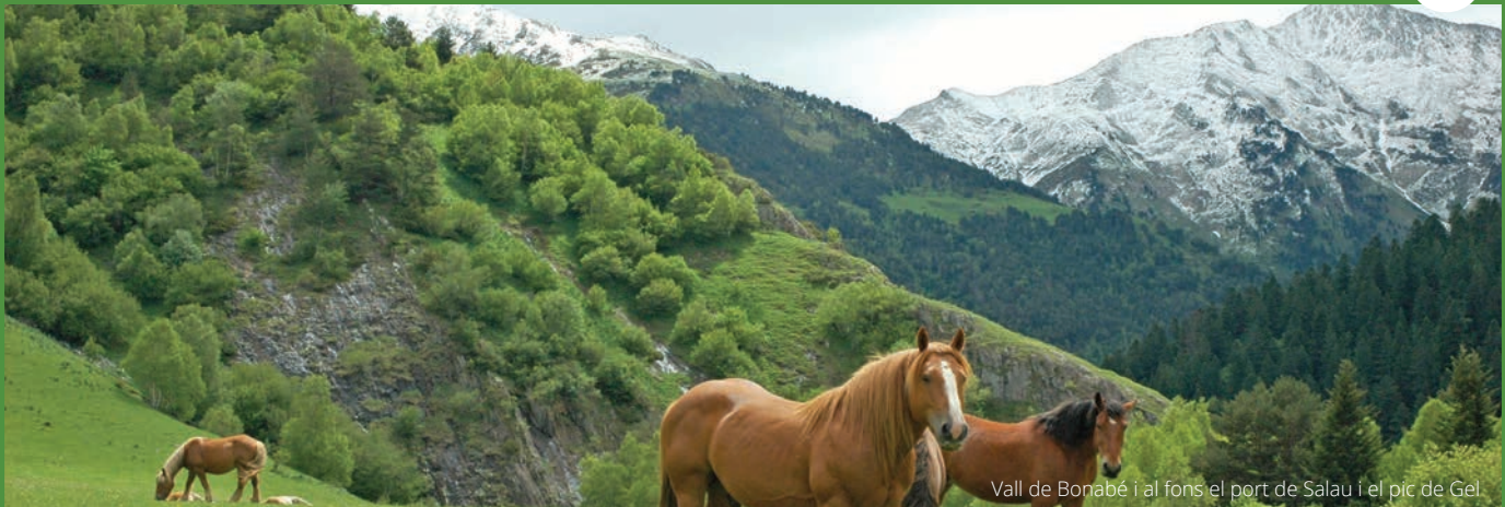
Vall de Bonabé i al fons el port de Salau i el pic de Gel