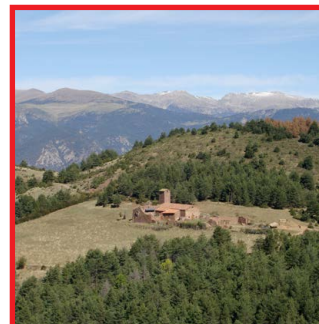
Santuari del Boscalt. Arxiu del P. N. del Cadí-Moixeró