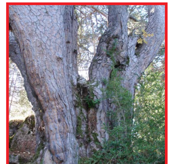
Pi de l'Orri, un arbre singular