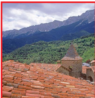
El Querforadat Autor: Richard Martín Vidal