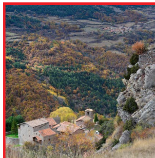
Cava Autor: Albert de Gràcia