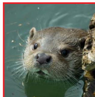
Llúdriga ( Lutra lutra)