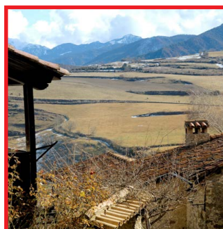
Vistes des de Montellà Autor: Richard Martín Vidal