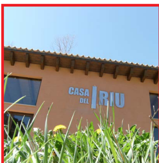
Casa del Riu