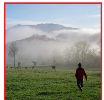
Producció de carn ecològica