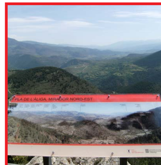
Ruta dels Miradors del Pla de l'Àliga