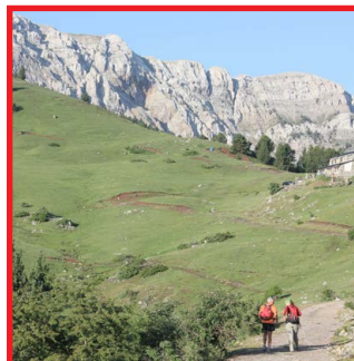
Prat d'Aguiló