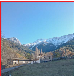
Santuari de Bastanist