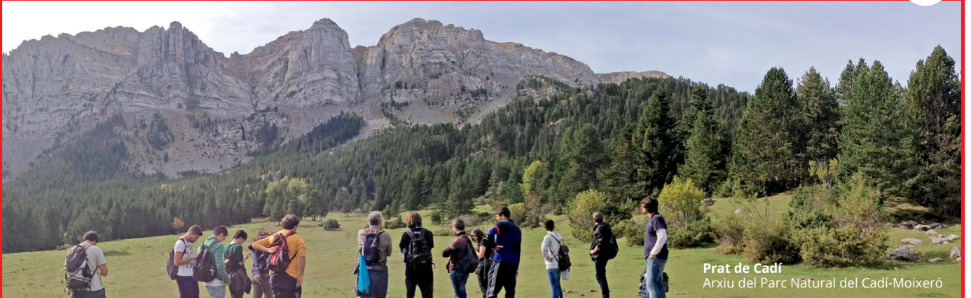
Prat de Cadí