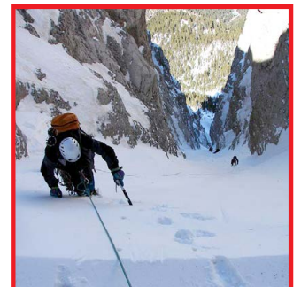
Canals de gel i neu a la cara nord del Cadí - Joan Casòliva