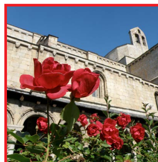
Catedral de Sant Maria de la Seu d'Urgell.