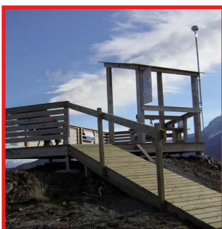
Mirador de Turó Galliner