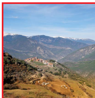
Vilanova de Banat Autor: Richard Martín Vidal