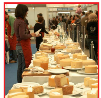
Fira de Sant Ermengol