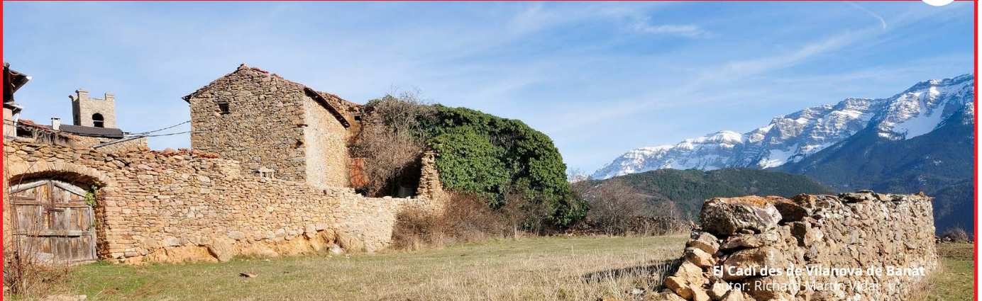
El Cadí des de Vilanova de Banat Autor: Richard Martín Vidal