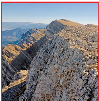
Torreta de Cadí