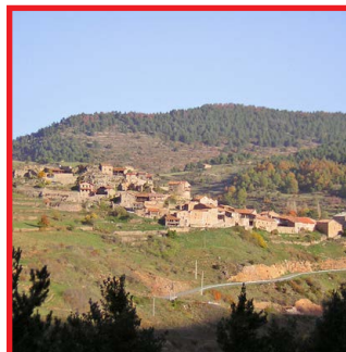
Adraén Arxiu del P. N. del Cadí-Moixeró