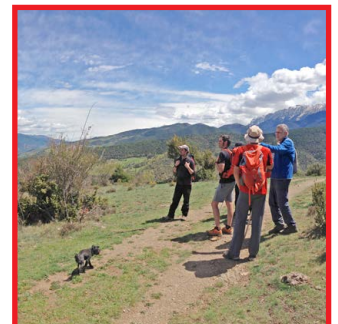
Camí de l'Últim Càtar