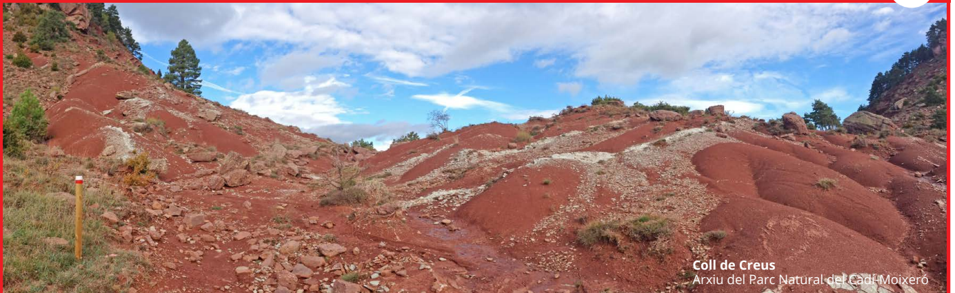
Coll de Creus Arxiu del Parc Natural del Cadí-Moixeró