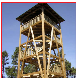
Torre Mirador d'Escobairó