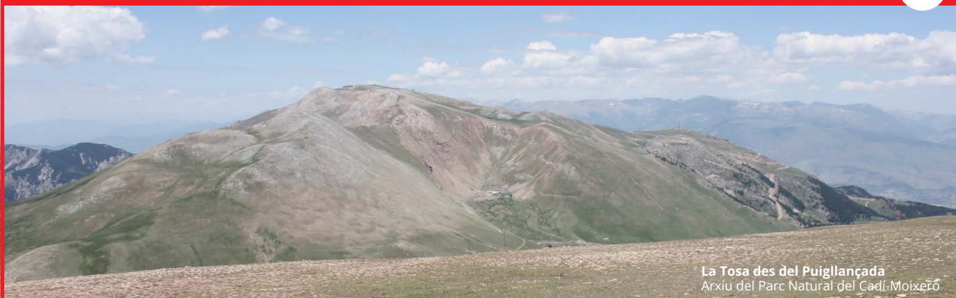
La Tosa des del Puigllançada