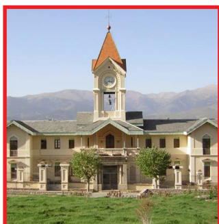
Casa del Comú de Das Arxiu del P. N. del Cadí-Moixeró