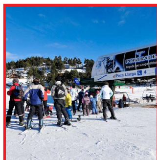
Pistes d'esquí