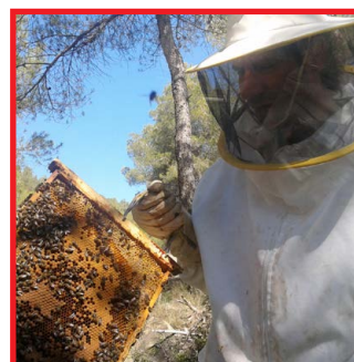
Artesà de la mel